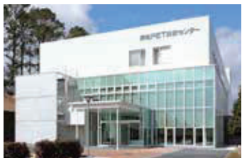
浜松PET診断センター

浜松PET診断センターでは、南東北がん陽子線治療センターと連携し、陽子線治療の担当医によるセカンドオピニオン外来を行っています。